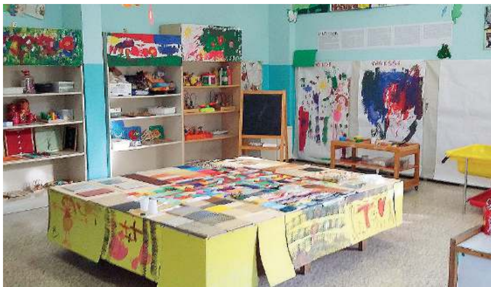
Al capolinea. Al prossimo anno scolastico si erano iscritti solo dieci bambini

Concesio, corso. L'associazione «Gianluca nel cuore» promuove un corso gratuito per l'utilizzo del defibrillatore. Per iscriversi contattare entro il 13 maggio lo 030.2751395.